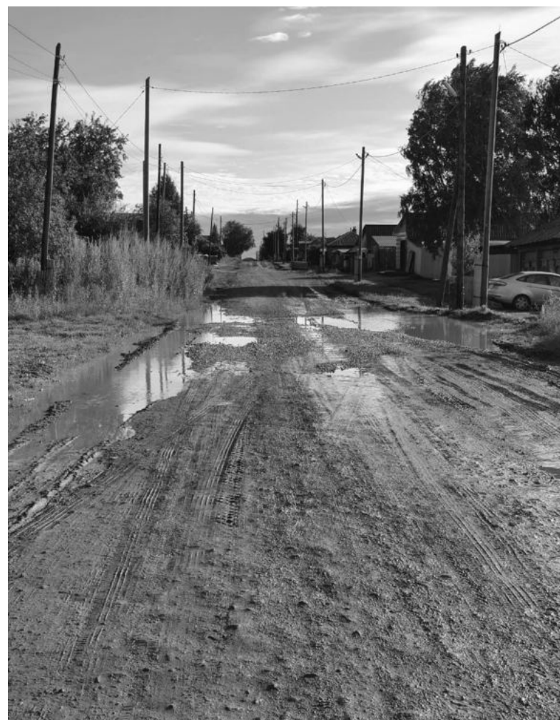
Первый километр дороги в Кекуре.

Строительство дорог в нашем регионе происходит в рамках программы «Развитие транспортного комплекса на территории Свердловской области до 2024 года». В текущем году на Среднем Урале отремонтируют шесть мостов и 251 километр региональных трасс. Всего на ремонт дорог, в том числе капитальные, из областного бюджета в этом году направлено 1,8 миллиарда рублей. В рамках национального проекта «Безопасные и качественные автомобильные дороги» на эти же цели выделено 1,2 миллиарда рублей - стоимость ремонта 83 километров дороги. Преимущественно ремонтируют дороги федерального значения, затем - регионально-го и в последнюю очередь дороги